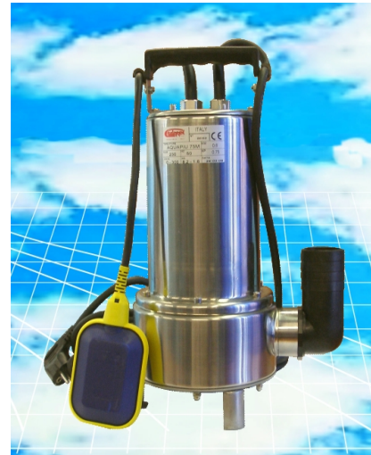
KPL. INOX PUMPA