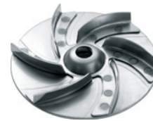
VORTEX ROTOR ANTIBLOCKING SYSTEM